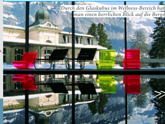
Durch den Glaskubus im Wellness-Bereich hat man einen herrlichen Blick auf die Berge

Waldhaus Flims, Via dil Parc, CH-7018 Flims, Tel. ++41 (0)81 9284848, info@waldhaus-flims.ch, www.waldhaus-flims.ch