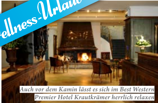
Auch vor dem Kamin lässt es sich im Best Western Premier Hotel Krautkrämer herrlich relaxen