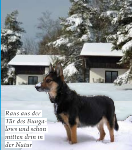
Raus aus der Tür des Bungalows und schon mitten drin in der Natur

Trotz der idyllischen Abgeschiedenheit im eigenen kleinen Bungalow kann man auf Gut Feuerschwendt den Service eines Hotels genießen. Mit Verwöhnküche und Wellness-Angeboten. Man kann wandern und die Gegend mit Hund auf Langlaufskiern oder hoch zu Ross erkunden. Wer noch mehr Action braucht, vom 21. bis 24.11. und 5. bis 8.12.2011 gibt es (sogar zum Sonderpreis) auf dem Hundetrainingsplatz ein Seminar zu Körpersprache, Leinenführigkeit und Mantrailing. Auch für Weihnachtsstimmung ist gesorgt. Es gibt viele kleinere Weihnachtsmärkte, wo man auch mit Hund entspannt bummeln kann. Gut Feuerschwendt 1, 94154 Neukirchen vorm Wald, Tel. 0049 (0) 8505 91290, info@gut-feuerschwendt.de www.gut-feuerschwendt.de