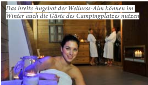
Das breite Angebot der Wellness-Alm können im Winter auch die Gäste des Campingplatzes nutzen

Grubhof A-5092 St. Martin bei Lofer, Tel. ++43 (0) 6588 82370 home@grubhof.com